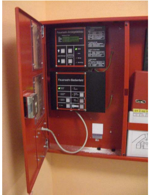
Bild 3: Oben: Feuerwehr-Anzeigetableau – Unten: Feuerwehrbedienfeld