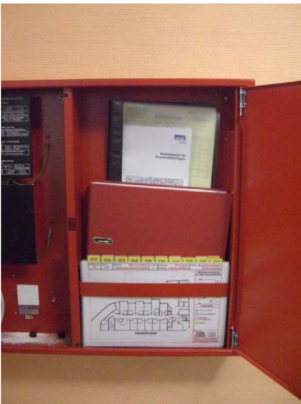
Bild 4: Oben: Betriebsbuch für Brandmeldeanlagen – Mitte ggf. Feuerwehrpläne – Unten Feuerwehr-Laufkarten